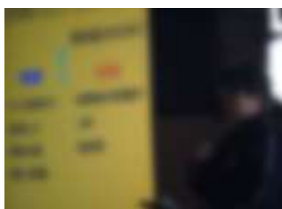
上級生のパフォーマンスを見入る1年生