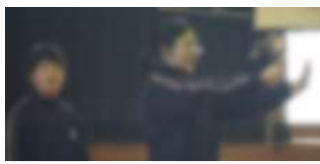
「おーい、まだ元気だよ～」遠足の途中で